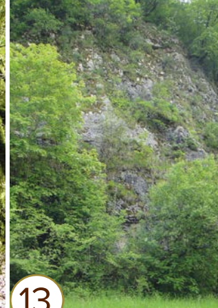
Grottes du Cirque