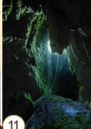
Grottes de Chenecey