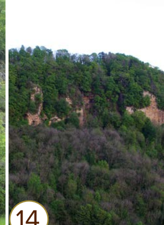
Grottes de la Côte de la Baume