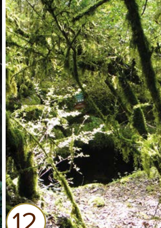
Gouffre du Creux à Pépé