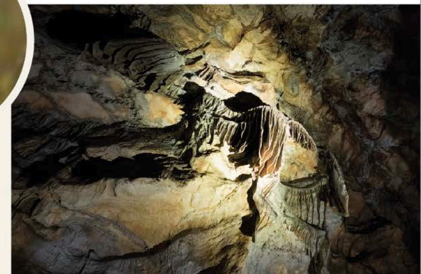
Concrétions dans une des grottes du réseau

Les réserves se situent en région karstique dont trois sites sont localisés sur le grand plateau structural de Haute-Saône, et quatre sur les plateaux et faisceaux du relief jurassien. La morphologie à l'intérieur des cavités présente de nombreuses concrétions riches et variées, et des rivières souterraines pour certaines d'entre elles.