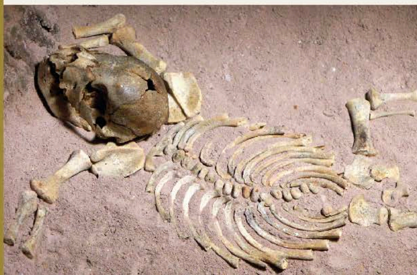
Squelette d'Ours des cavernes

Toutes les réserves, sauf une, ont fait l'objet d'inventaires archéologiques et paléontologiques. Certaines cavités du réseau ont abrité des humains à partir du paléolithique. Aussi, plusieurs centaines de vestiges d'animaux ont été sauvés des pillages avec notamment un squelette presque complet d'ours des cavernes nouveau-né ( Ursus spelaeus ), aujourd'hui conservé au Musée de Montbéliard.