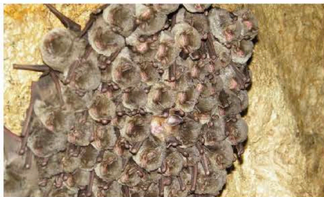
Colonie mixte de Minioptère de Schreibers et de Rhinolophe euryale

Eboulis, forêts de pentes, falaises calcaires, pelouses sèches et grottes sont autant d'habitats remarquables présents sur les 75 hectares du réseau de réserves. Ces milieux sont notamment liés à la présence d'un sous-sol karstique calcaire. Rares à l'échelle européenne ou en fort déclin, ces milieux nécessitent une attention particulière pour veiller à leur maintien.