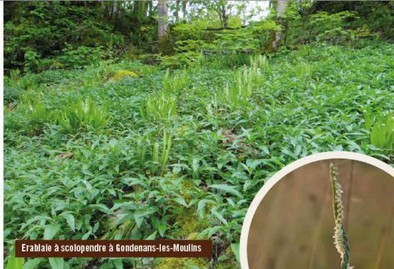
Erable à scolopendre à Gondenans-les-Moulins