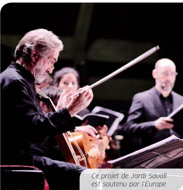
Ce projet de Jordi Savall est soutenu par l'Europe